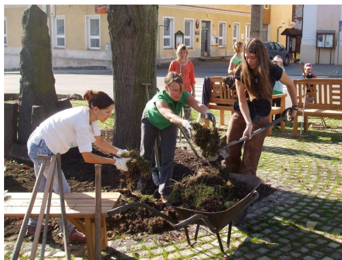
V letech 2013—2014 došlo na nadějkovském náměstí k realizaci navržených úprav a brigádnicky se částečně podařilo provést některé uvažované práce.