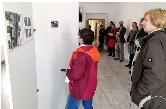
Březnové veřejné projednání budoucího vzhledu náměstí dodalo tomuto tématu další impuls a směr.

Umístění nových prvků pro děti by obec chtěla řešit ve spolupráci s autory a realizátory projektu Farská zahrada, což je v současné době jistě krásné místo pro setkávání. Prostoru pro