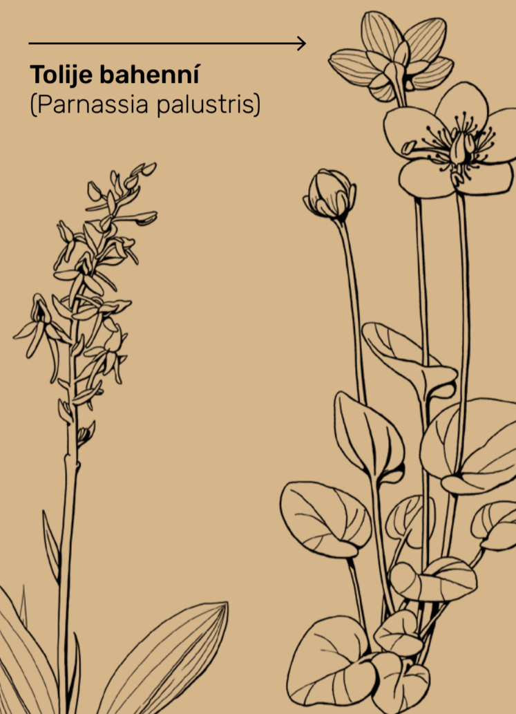
Tolije bahenní (Parnassia palustris)

Vachta trojlistá rozkvétá v květnu až červnu drobnými bledě růžovými kvítky. Její listy se dříve přidávaly do piva, aby mu dodaly hořkou chuť.