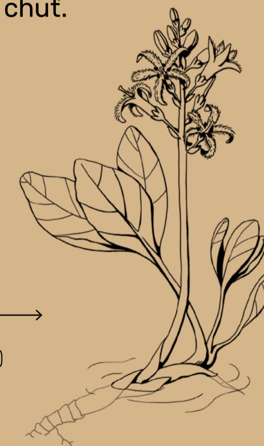
Vachta trojlistá (Menyanthes trifoliata)