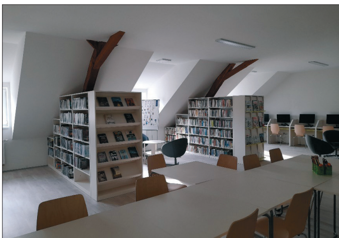
Polyfunkční komunitní centrum s knihovnou.

Rozsahem největší investicí, nejen právě uplynulého období, byla celková rekonstrukce domu č. p. 5