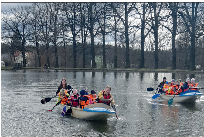
TiMe - plavba po rybníce.