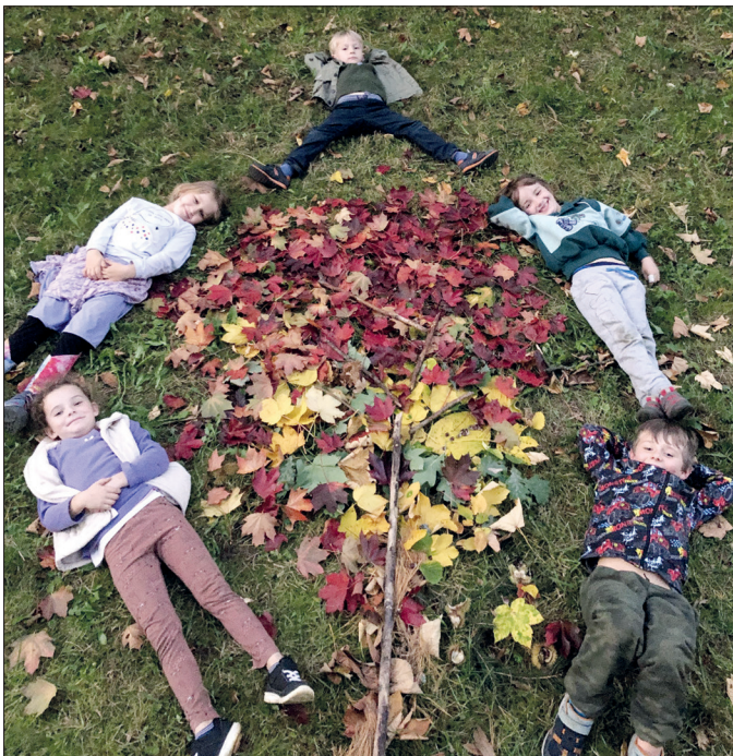
Strom z barevného listí na jedné z podzimních schůzek.