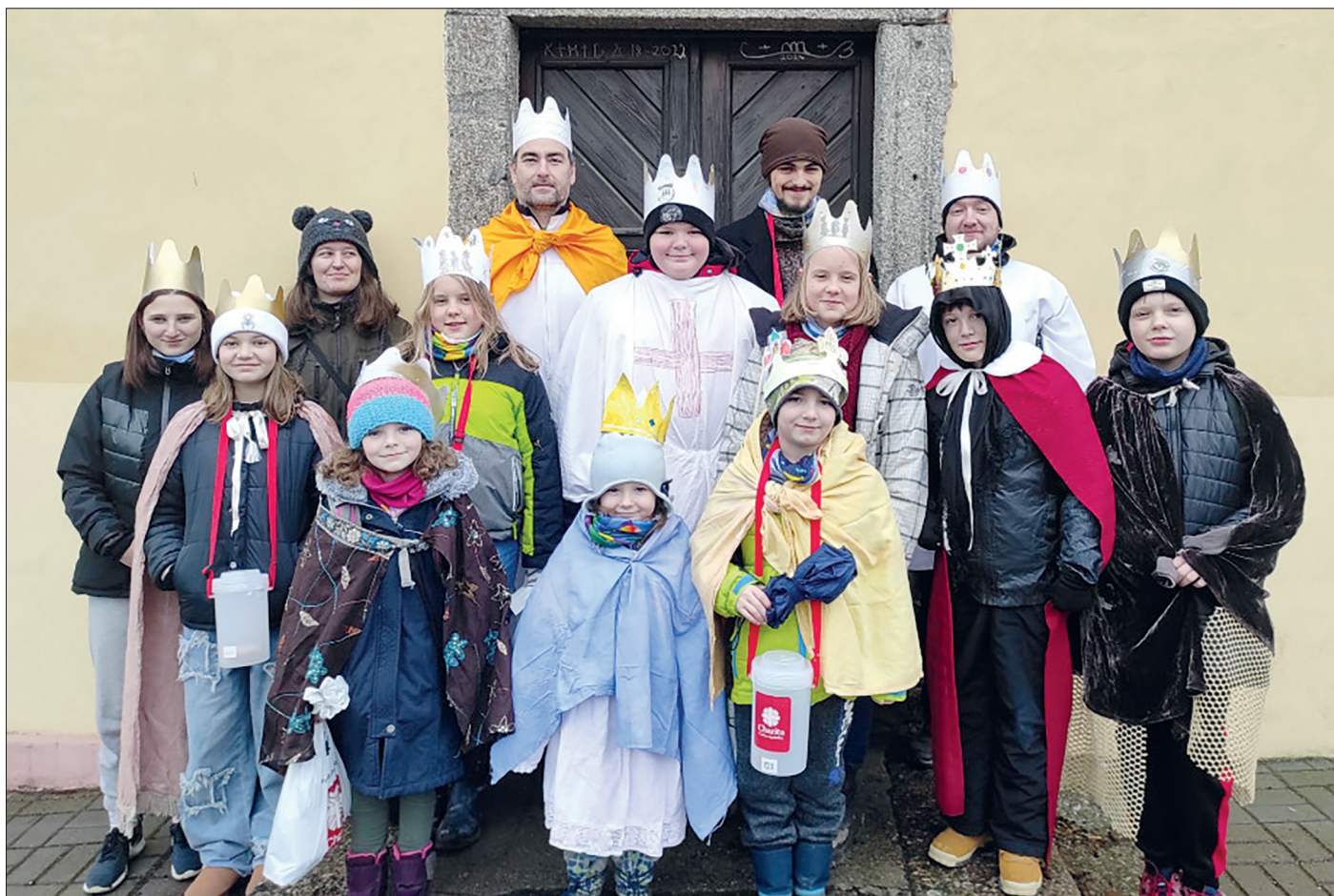
Skupinová tříkrálová fotka.

V sobotu 16. března jsme se rozjeli do Opařan, kde se konala akce zvaná TiMe (na počest zakladatelů přístavu Třináctka Opařany, Tipa a Melouna). Byly zde děti i dospělí ze všech oddílů, které do Třináctky patří, tedy opařanských, jistebnického i toho našeho, nadějkovsko-sepekovského. Dohromady to byla spousta lidí, odhadem určitě aspoň stovka. Rozdělili jsme se do skupinek, a pak nás čekalo putování po několika místech v okolí s různými úkoly, jako je například plavba po rybníce, sestřelování plechovek prakem, lezení po provazové síti nebo