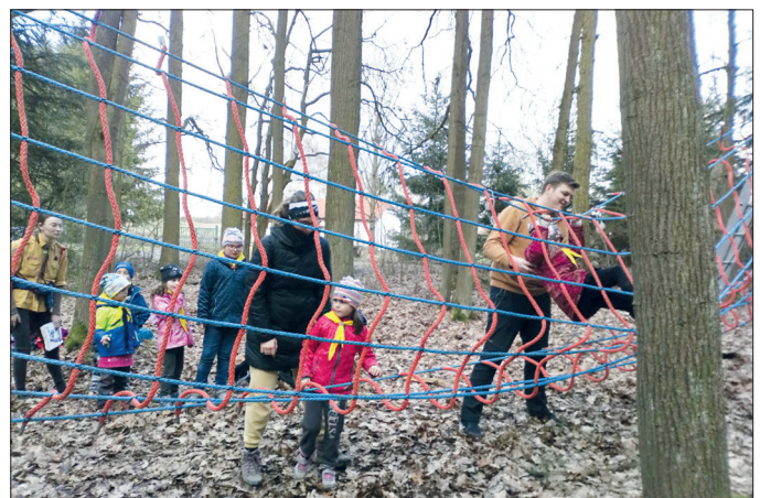
TiMe - lezení po provazové síti