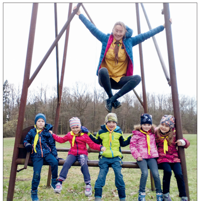
TiMe - skupinka nejmladších účastníků z Nadějkova.