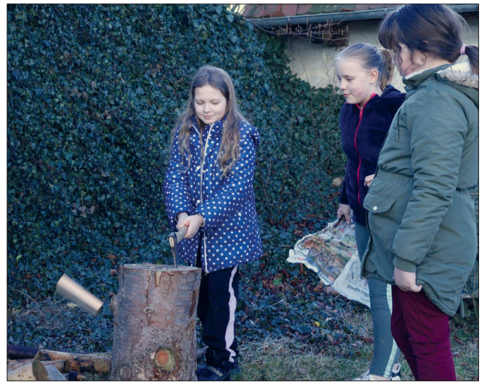
Zvašiček v Sepekově - příprava dříví na oheň.